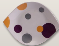
Platte oval 22 cm