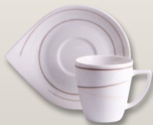
Kaffeeobertasse 0,2 l