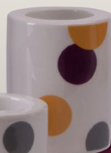
Teelichtleucher 16/12/8/4 cm