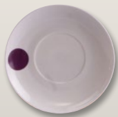
Untertasse glatt 15 cm