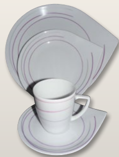
Dekor Streifen aubergine-grau