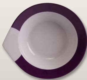
Schüssel 23 cm