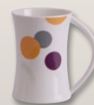
Becher Swing 0,2 l