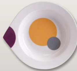
Teller tief 24 cm