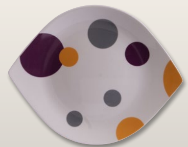
Platte oval 33 cm