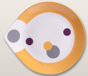
Teller flach 30 cm