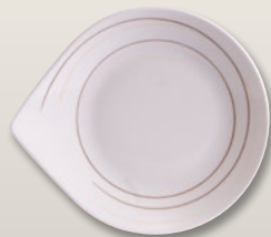
Teller flach 22 cm