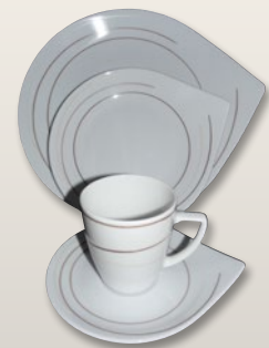
Dekor Streifen beige-schoko