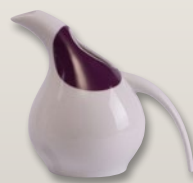
Sauciere 0,5 l