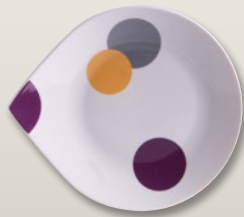
Teller flach 21 cm