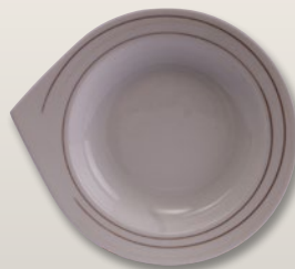
Teller tief 27 cm