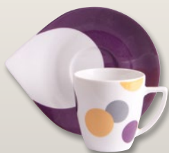
Kaffeebecher aubergine 0,3 l