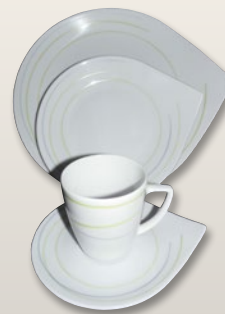
Dekor Streifen grün-grau