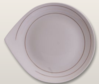
Teller flach 30 cm