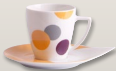
Obertasse 0,2 l Untertasse gelb 17 cm