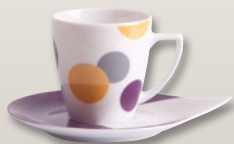
Obertasse 0,2 l Untertasse aubergine 17 cm