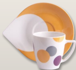
Kaffeebecher gelb 0,3 l