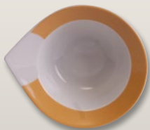
Schüssel 20 cm