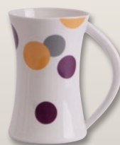
Becher Swing 0,4 l